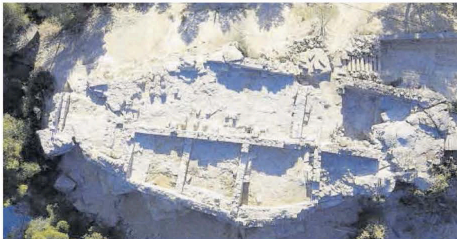
Vista actual amb dron de les restes de l'antic castell

A partir d'aquí i amb el pas dels segles, va anar tenint diversos propietaris, però l'estructura es va anar deteriorant fins a presentar un estat ruïnós per la Guerra dels Segadors. Força abans, entre els segles XIII i XIV, la torre original es va ensorrar, tot i que es va reconstruir fins a ser novament destruïda per la guerra civil catalana que hi va haver entre el 1462 i el 1472.