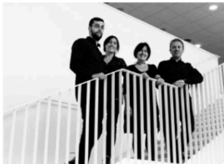
Equipo Santamaria Arquitectes