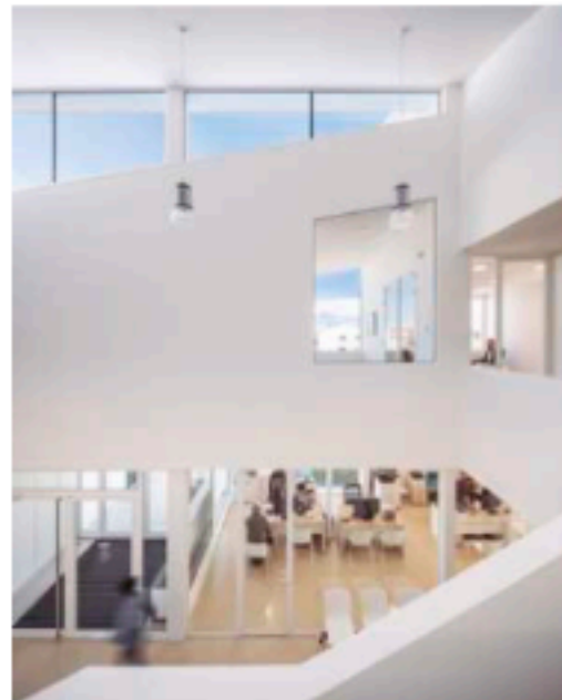
Ayuntamiento en Castellví de la Marca. (BCN)