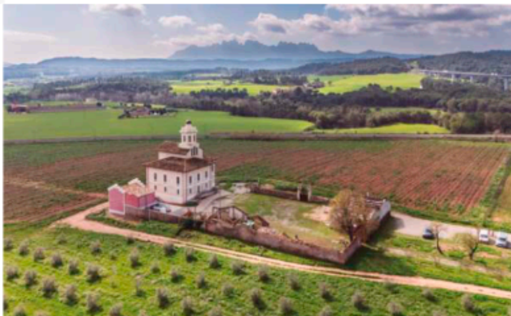
Rehabilitación Torre Lluvià, Manresa (BCN)