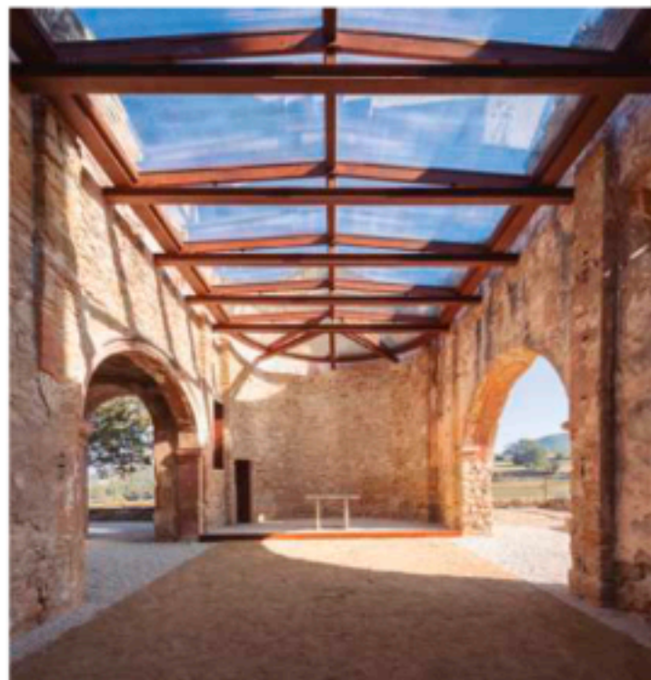
Rehabilitación Iglesia Sant Esteve, Marganell (BCN)