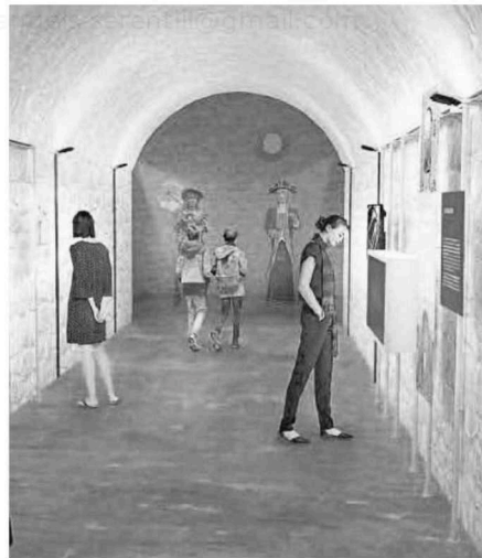
Imatge simulada de la museització de l'ermita